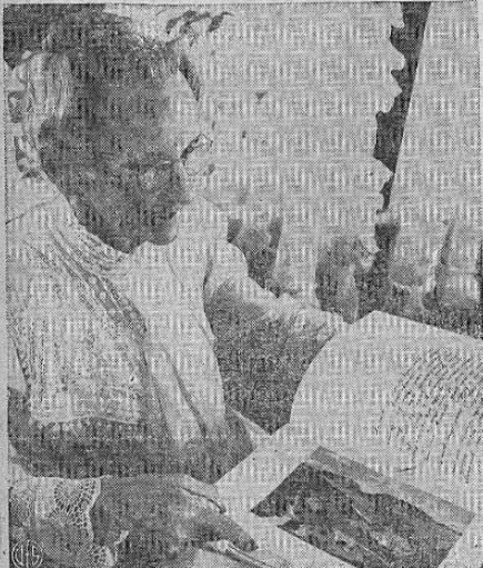
SE ACERCA A LOS 88 AÑOS — Ana Mary Robertson Moses, conocida como la "abuelita de Moisés", es una de las famosas pioneras de arte primitivo de los Estados Unidos, celebró su octogésimo octavo cumpleaños el 7 de septiembre. Esta señora no tocó los pinces sino hasta que cumplió los 77.

CARACAS, 15 UP — Círculos autorizados informaron esta noche a Venezuela presentó una nota diplomática del Perú por redistribución de policías peruanos en terrenos de la embajada venezolana en Lima, en busca de un periodista aprista asilado en dicha embajada. Agregaron dichas fuentes que la cancillería pidió excusas, dándose por terminado el asunto.