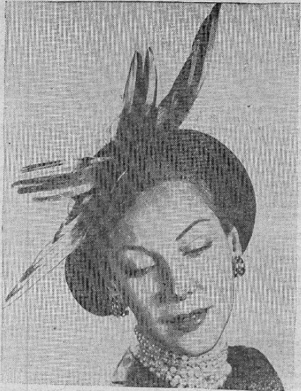
SOMBREIRO CON ALAS — Dos pares de alas salen de la corona de este sombrero de zafiro azul que está luciendo en la colección de sombreros de Jay Thorpe de Nueva York.